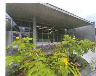
La coursière d'accès aux salons