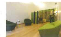
L'un des six salons

Cette salle est équipée d'un grand écran et d'une sonorisation afin de personnaliser les cérémonies. Pour les personnes ayant fait ce choix, le Centre Funéraire est équipé d'un crématorium moderne et d'un salon de remise d'urne.