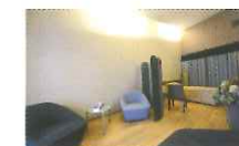
Un autre salon